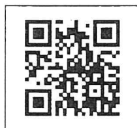
สิ่งที่ส่งมาด้วย ๒