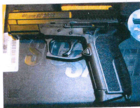
SIG SAUER SP2022 9 มม.