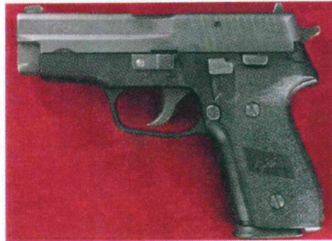
SIG SAUER P228 9 มม.