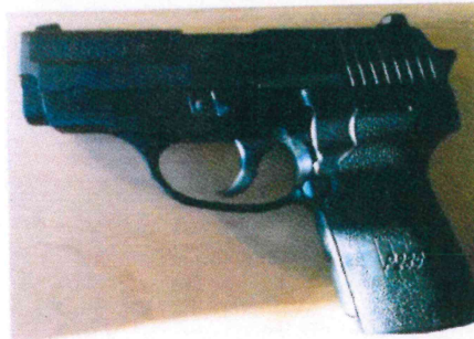
SIG SAUER P239 BL 9 มม.