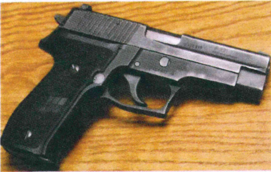
SIG SAUER P226 SL Black 9 มม.