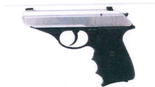
SIG SAUER P232 TT .380 ACP