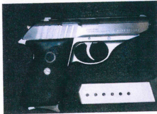
SIG SAUER P232 SL .380 ACP