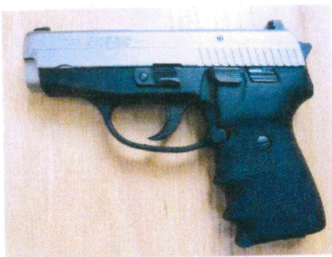
SIG SAUER P239 SL 9 มม.