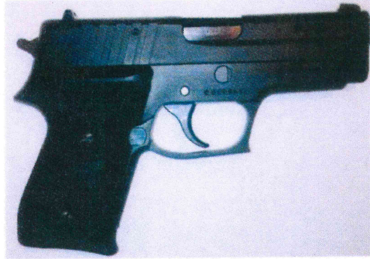
SIG SAUER P245 .45 ACP (11 มม.)