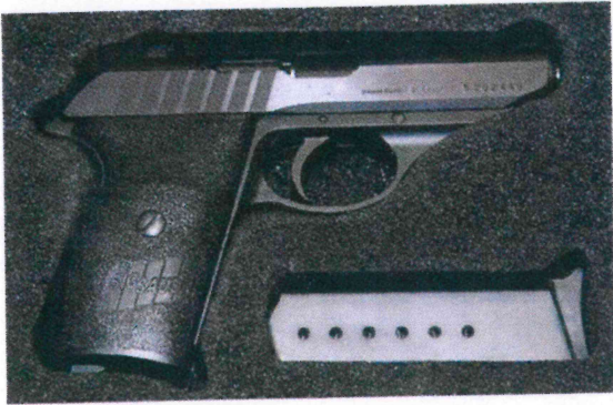
SIG SAUER P232 BL .380 ACP