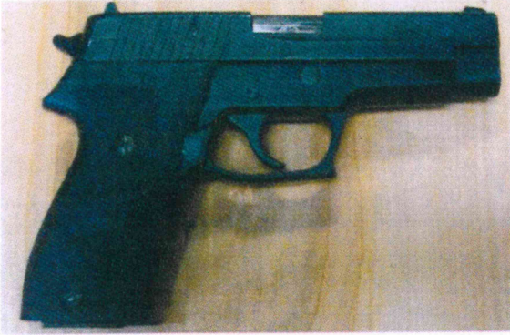
SIG SAUER P220-1 .45 ACP (11 มม.)