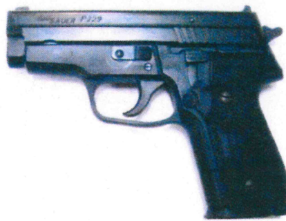
SIG SAUER P229 SL Black 9 มม.